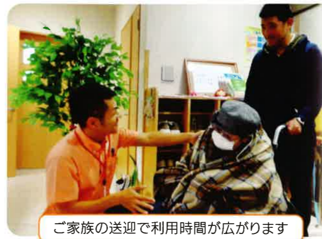
ご家族の送迎で利用時間が広がります