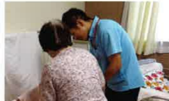
身近な悩みも一緒に解決

『通い』『訪問』『宿泊』…通常では別々の事業所で利用するサービスを、一箇所で全て利用出来ます。いつも同じスタッフが対応しますので、気兼ねなくサービスが利用できます。