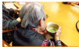
昔習った茶道に挑戦

朝早くから夜遅くまでの利用が可能で、急な延長をする場合でも延長料金は不要です。介護の為に仕事を辞める…そんな心配はありません！安心して仕事と介護を両立する事が出来ます。 ○通い対応時間：7時～21時まで（送迎希望の方は8時～18時）