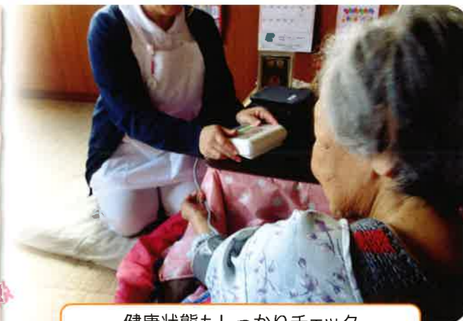
健康状態もしっかりチェック

市内で一人暮らしをしている母が心配で、気にはしているが、県外で暮らす私も生活があり中々様子を見に行けず…。一時は仕事を辞めないといけないと思っていましたが、南天の郷のスタッフさんが一日一回様子を見に行き下さり、毎週連絡を下さるので安心してお任せ出来ています。電球の交換から冬の雪かきまで、細かいところも手伝ってくれるので母も感謝しています。