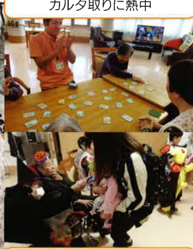
子供達と一緒にハロウィンを